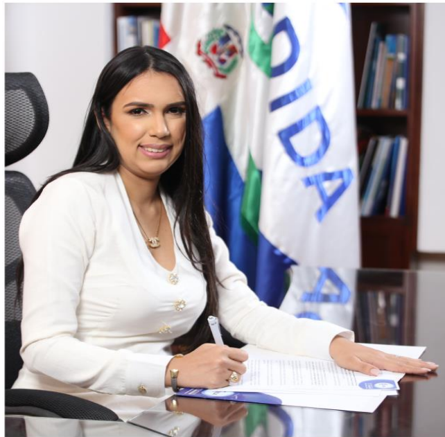
Directora General de la DIDA