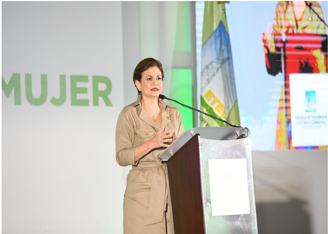
Sra. Raquel Peña Rodríguez, vice presidenta de la Republica