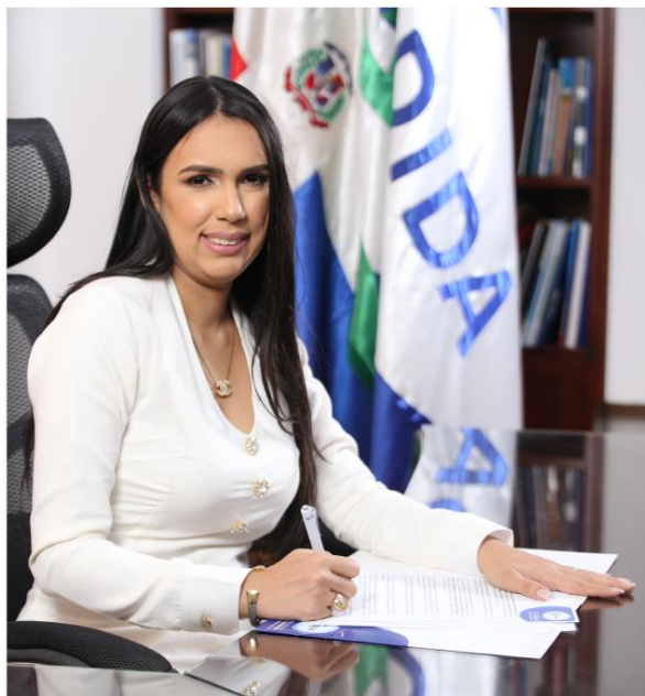
Directora General de la DIDA